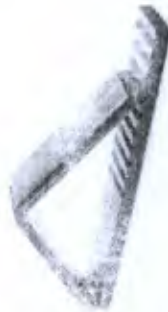
Tábua para Quadríceps com Cinta Cod. PA00264A