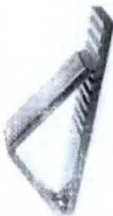
Tábua para Quadriceps com Cinta