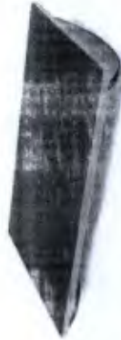
Tábua Proprioceptiva Retangular Cod. 00132A