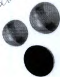
Meia Lua para Equilíbrio