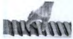
Escada Dígita Cod. D0050A