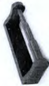
Rolo de Punho Cod. 00127B