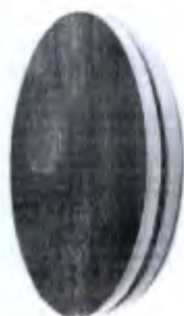
Disco de Rotação 39cm