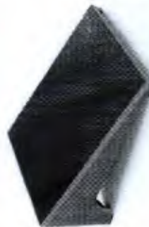
Tábua Proprioceptiva Triceps Sural