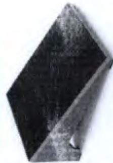
Tábua Proprioceptiva Triceps Sural Cod. PA00208A