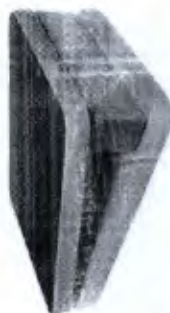
Tábua Proprioceptiva Postural com 3 Níveis de Altura