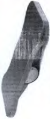
Tábua Lateral Proprioceptiva Cod. 001180