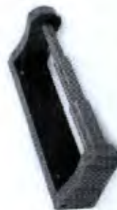
Rolo de Punho