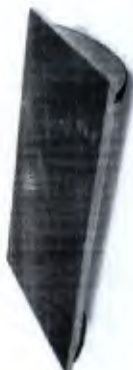
Tábua Proprioceptiva Retangular