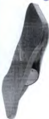
Tábua Lateral Proprioceptiva