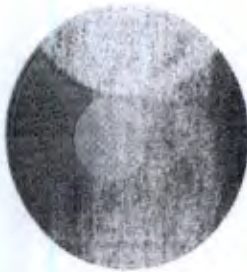
Disco Proprioceptivo com 1 Nível de Dificuldade Cod. IP00246A

GOVERNAMENTO DO PARANÁ PÁGINA 404 C.O. 2014