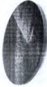
Tábua Proprioceptiva Redonda Cod. 00129A