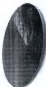
Tábua Proprioceptiva Redonda