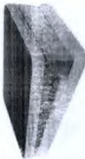
Tábua Proprioceptiva Postural com 3 Níveis de Altura Cod. PA00188A