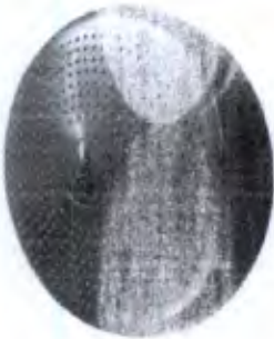
Disco Proprioceptivo Infiável Cod. IP00261A