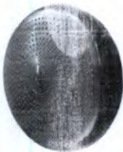
Disco Proprioceptivo Inflável