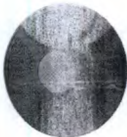
Disco Proprioceptivo com 1 Nível de Dificuldade