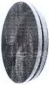
Disco de Rotação 39cm Cod. PA00356A