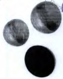
Meia Lua para Equilíbrio 3 Unid. / Cod. PA00260A