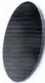
Tábua Proprioceptiva Redonda