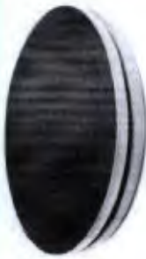
Disco de Rotação 39cm

DEPARTAMENTO DE PREGÃO - P.M. DE 519 PÁGINA 22