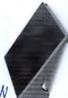
Tábua Proprioceptiva Triceps Sural