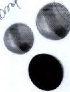
Meia Lua para Equilíbrio