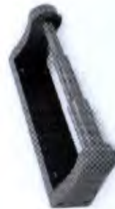
Rolo de Punho