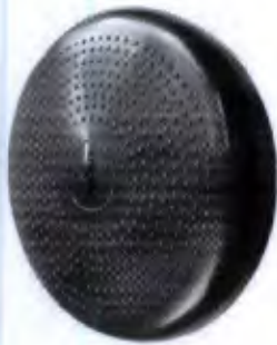
Disco Proprioceptivo Inflável