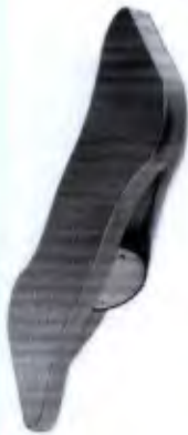
Tábua Lateral Proprioceptiva