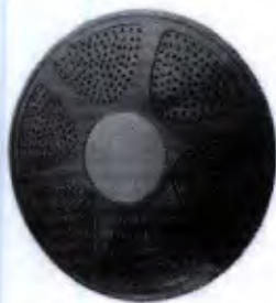
Disco Proprioceptivo com 1 Nível de Dificuldade