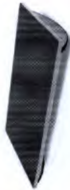
Tábua Proprioceptiva Retangular