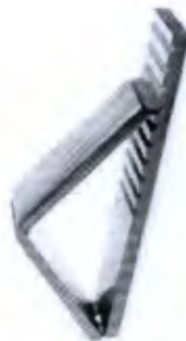
Tábua para Quadriceps com Cinta