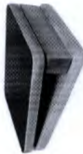
Tábua Proprioceptiva Postural com 3 Níveis de Altura