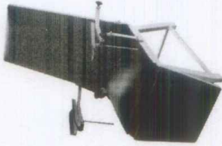
CADEIRA DE COLETA

Fabricada em estrutura de tubo retangular de 50 x 30 mm; 20x20 mm e 25 x 25 mm, em aço carbono, com assento, encosto e descanso para os pés anatômicos. Estofados com espuma de alta densidade, revestidos em couro/im. Braçadeira em aço carbono e dois apoios para os braços, removíveis, com altura regulável e estofada com revestimento em couro/im. Pés com ponteiros de borracha e acabamento em pintura eletroestática a pó, com eficiência anticorrosiva por meio de fosfatização. Próprio para seções de Hemodiálise e coleta de sangue.