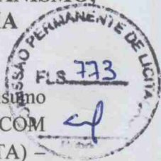
Tabela 01 – Análise de impacto do erro no cálculo do adicional de periculosidade de 30% (insumo INS-PMH01) para o profissional mensalista da composição CPMH-03 – ELETRICISTA COM ENCARGOS COMPLEMENTARES E ADICIONAL DE PERICULOSIDADE (MENSALISTA) – MÊS.