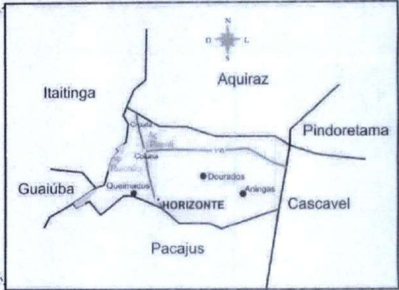
Situação do Município