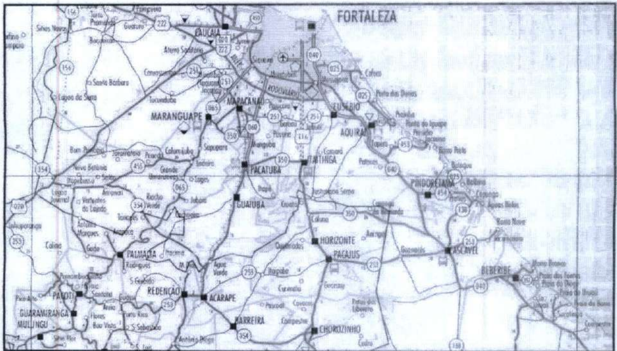
Acessos ao Município