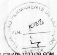
TABELA: SEINFRA 027.1 COM DESONERAÇÃO E SINAPI 2022/09 COM DESONERAÇÃO BDI: 29,07%

OBRA: SERVIÇOS DE MANUTENÇÃO E CONSERVAÇÃO DOS ESTÁDIOS E CAMPOS DE FUTEBOL LOCAL: HORIZONTE-CE REF.: CONCORRÊNCIA PÚBLICA Nº 2023.03.20.1/2023 RAZÃO SOCIAL: CLEZINALDO CONSTRUÇÕES LTDA - EPP CNPJ: 22.575.652/0001-97