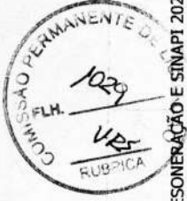
TABELA: SEINFRA 027.1 COM DESONERAÇÃO E SINAPI 2022/09 COM DESONERAÇÃO BDI: 29,07%